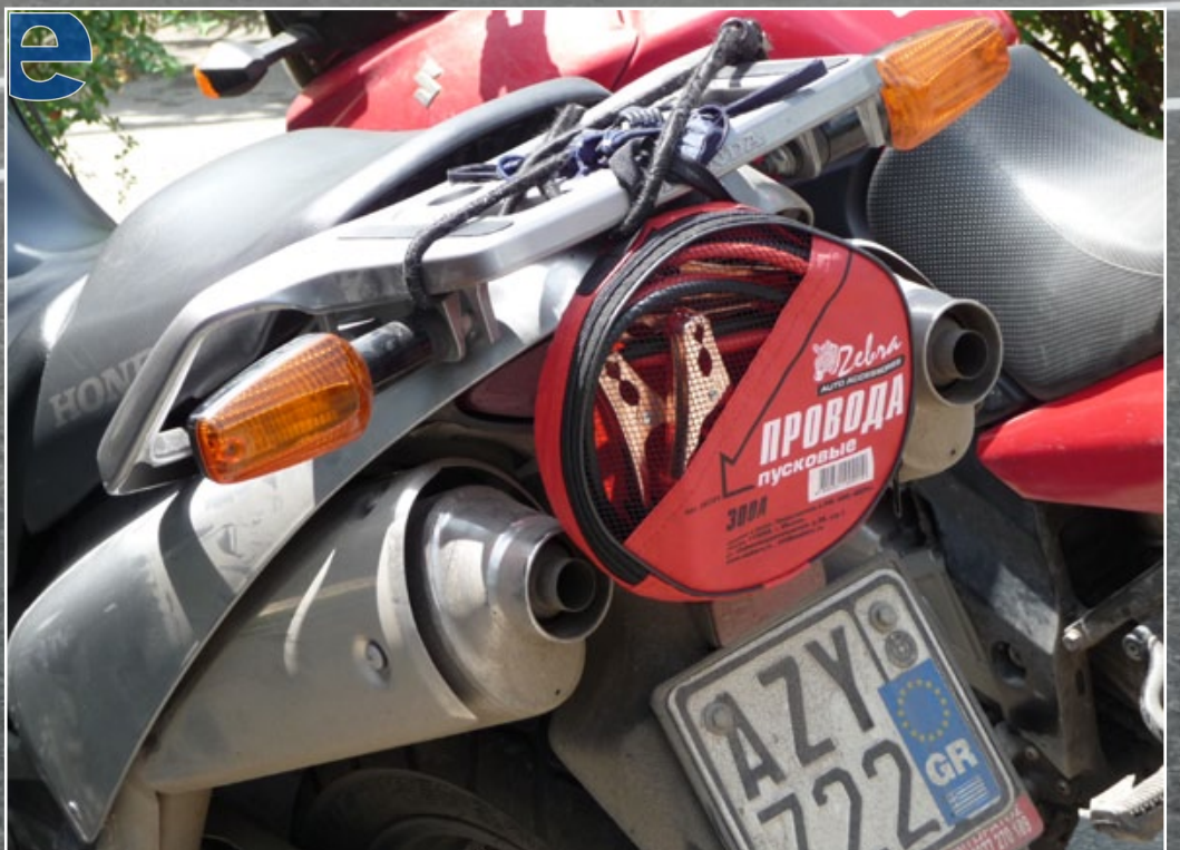
Αυτά τα "άγια" καλώδια θα μας συντροφεύσουν από δω και πέρα σε όλο μας το ταξίδι!