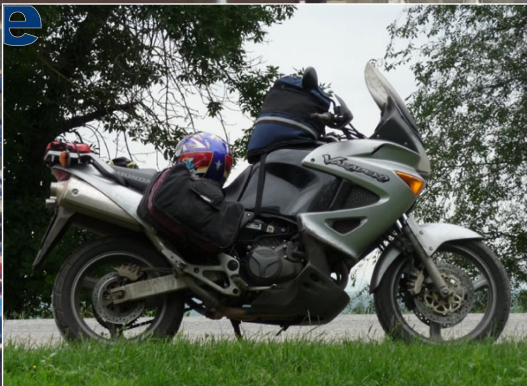
Η μηχανή φορτωμένη. Εκτός από το θέμα με τη μπαταρία δε μας απασχόλησε καθόλου σε όλη τη διάρκεια του ταξιδιού